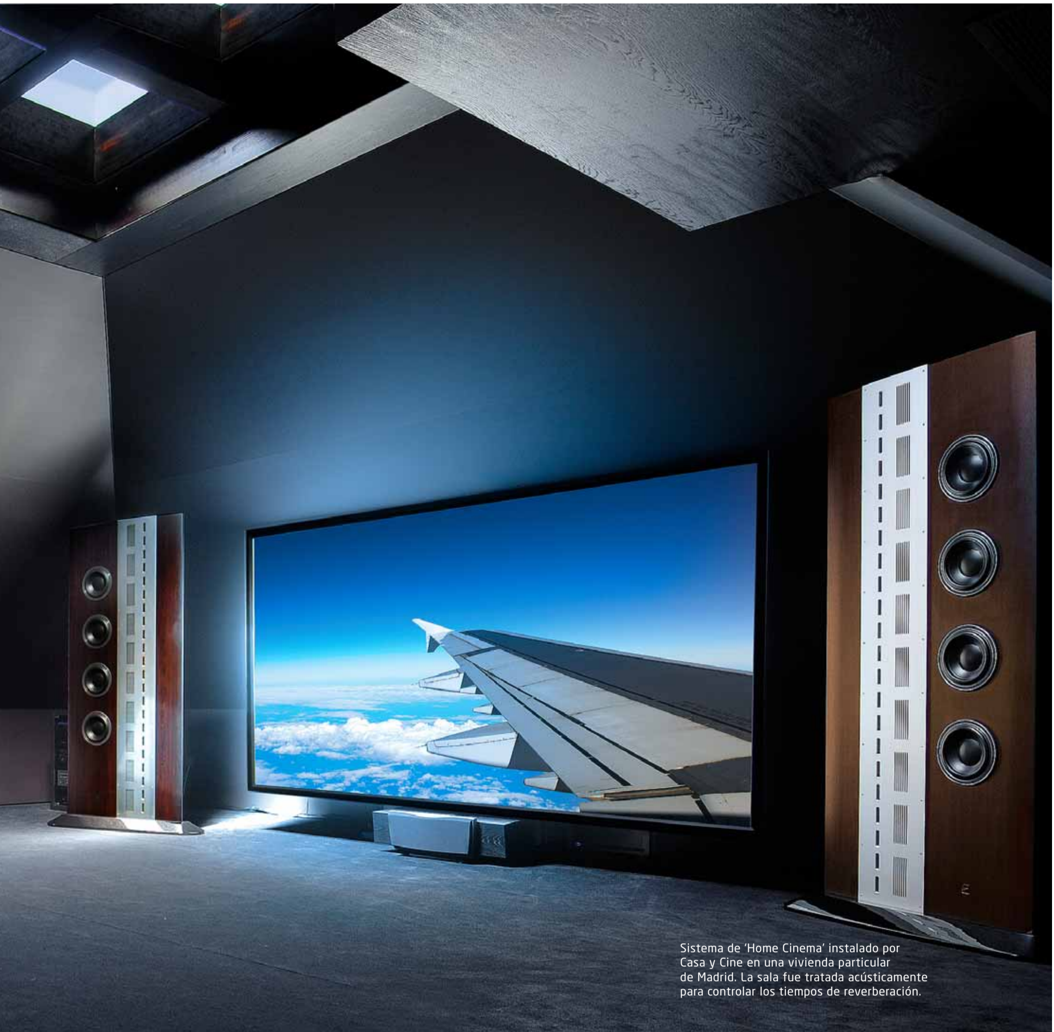
Sistema de 'Home Cinema' instalado por Casa y Cine en una vivienda particular de Madrid. La sala fue tratada acústicamente para controlar los tiempos de reverberación.

para calcular el espacio y conocer sus necesidades estéticas. Se determinará también qué sistema se desea: un 5.1 o, si es un salón gigantesco, un 7.1. "El objetivo es que el cliente adquiera sólo lo que necesita y, sobre todo, que su inversión se vea y se oiga, sin retóricas técnicas". Lo ideal es empezar el proyecto mientras la casa está aún en obras. Así se indican las canalizaciones y las necesidades de electricidad, lo que permitirá que los cables no se vean. Una segunda fase tendrá lugar tiempo después, con las obras recién acabadas y los clientes a punto de mudarse. Es el mo-